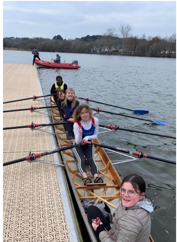
Equipage fille avec Glerminda : 4ème place.